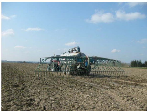
Figure 1 : Epandage du digestat et du lisier avec un tonneau type « pendillard »

Les matières organiques ont été appliquées à l'aide d'un tonneau à lisier équipé de déflecteurs proches du sol (type pendillard – figure1) et incorporées directement après l'épandage.