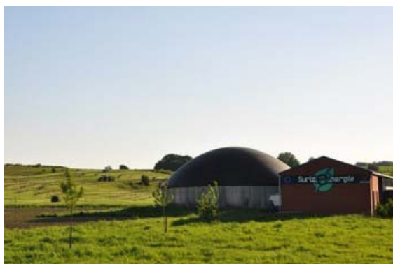
Figure 2 : Vue de l'unité de biométhanisation de Surice - Surizenergie

Les matières organiques introduites dans le fermenteur se répartissent en moyenne comme suit :